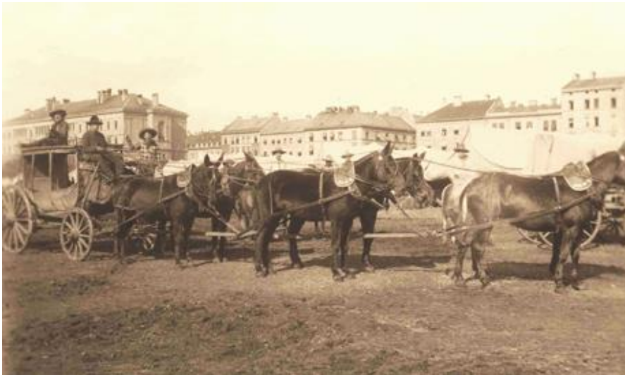
Buffalo Bills Wild-West-Show im Jahr 1890 auf der Theresienwiese

Lola Montez bei den Goldgräbern, Buffalo Bill auf der Theresienwiese – im Gasteig München zeigt die Ausstellung „München und der Wilde Westen“ von 1. Februar an überraschende Einblicke in ein vergessenes Kapitel Kulturgeschichte