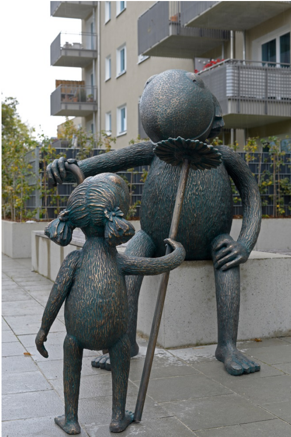
Die Schmolche vor dem GEWOFAG-Neubau an der Passauer Straße (Foto: GEWOFAG).