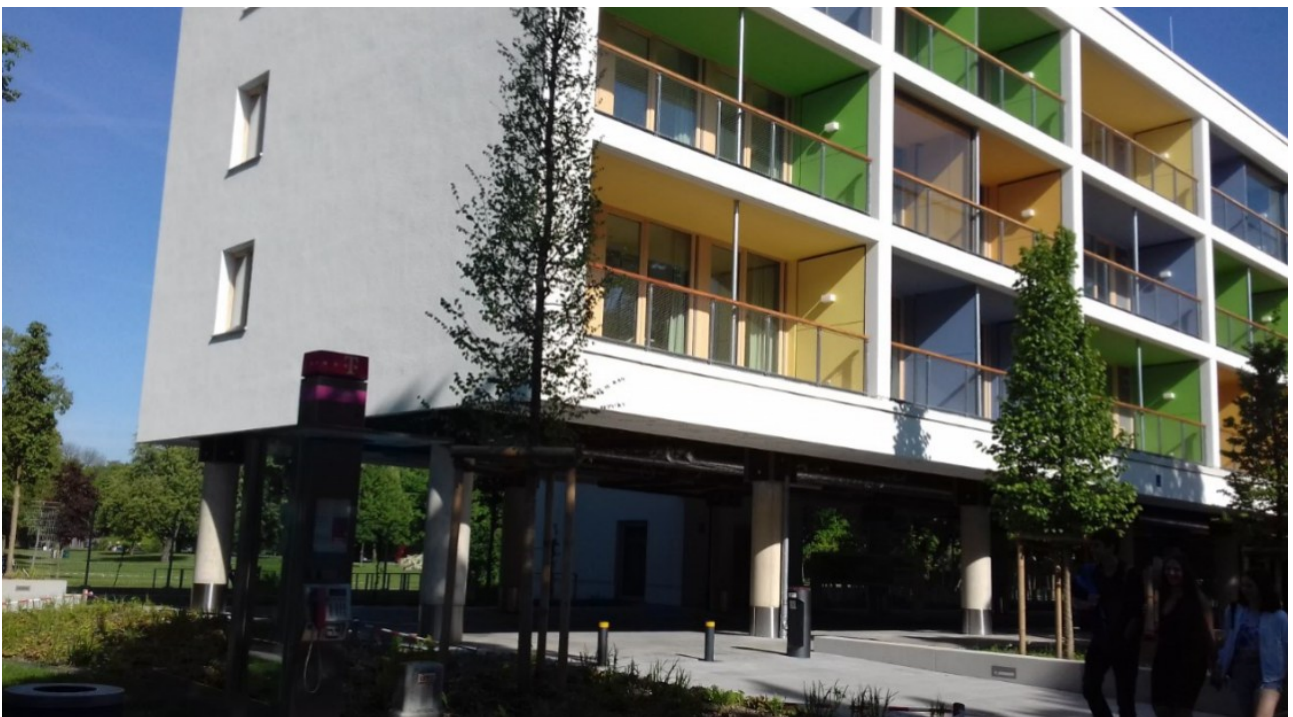
Die 56 Werkwohnungen der Stadtwerke in der Dantestraße – mit freiem Blick auf's Dantebad!

Diese Ansätze und Entwürfe sollten realisiert und fortgesetzt werden.