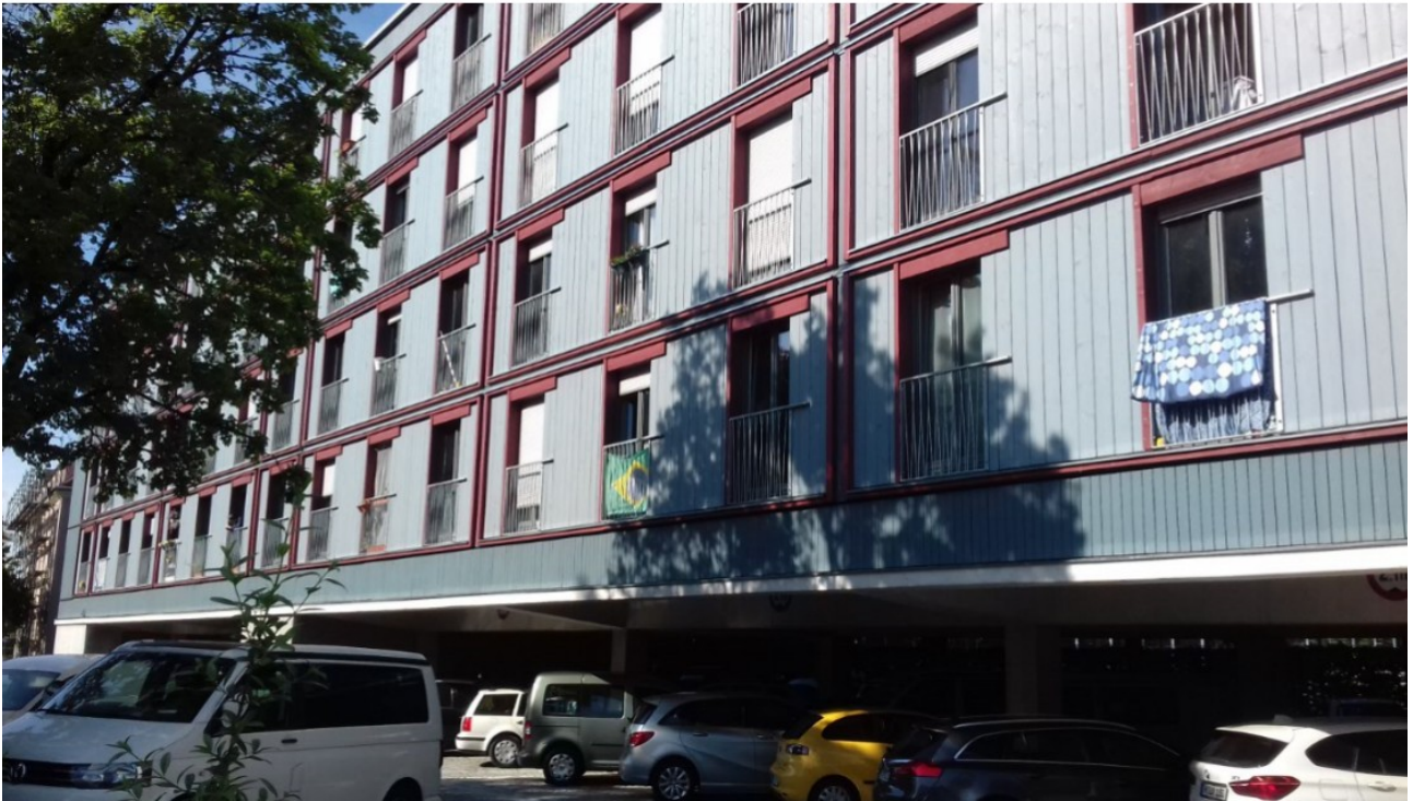
Stelzenbau „Wohnen für alle“ in der Homerstraße am Dantebad/Ostseite