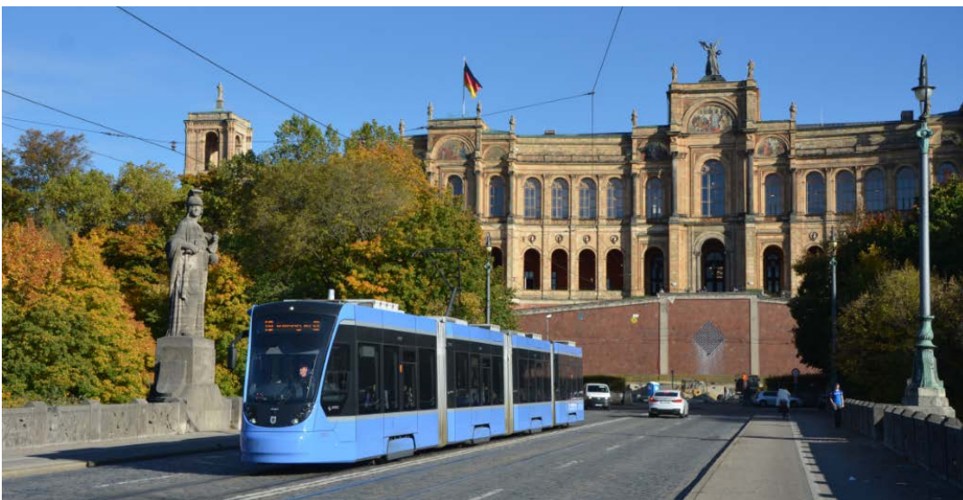
Ein moderner Niederflurzug vom Typ Avenio

Hinweis: Die Fotos stehen unter www.swm.de/presse zur Verfügung.