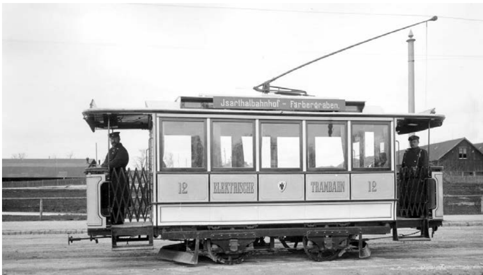
Einer der ersten elektrischen Triebwagen auf der Linie Färberggraben – Isartalbahn in der Schäftlarnstraße (1895)

Seit 125 Jahren nutzen die Münchnerinnen und Münchner Elektromobilität: Am 27. Juni 1895 wurde die erste Tramstrecke komplett auf elektrischen Betrieb umgestellt, nachdem am 23. Juni bereits eine Teilumstellung erfolgt war. In den 1970er-Jahren kam die U-Bahn dazu. Über dieses Jubiläum freut sich die Münchner Verkehrsgesellschaft (MVG) gemeinsam mit dem Fahrgastverband PRO BAHN, dem Arbeitskreis Attraktiver Nahverkehr (AAN) im Münchner Forum sowie dem Omnibusclub München (OCM) und den Freunden des Münchner Trambahnmuseums (FMTM).