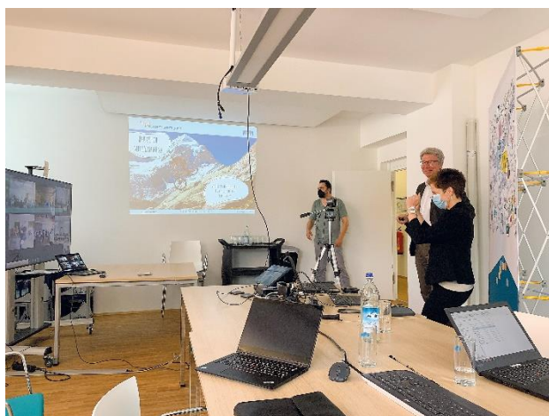
BU: Virtuelle Begrüßung aufgrund von Corona