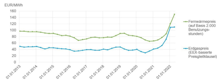
Vergleich der Preisentwicklung von Erdgas (Verträge mit Preisgleitklausel) und Fernwärme seit 2013

Bitte beachten Sie bei der Grafik, dass Erdgas eine Primärenergie ist, welche noch mit Wirkungsgradverlusten in Wärme umgewandelt werden muss.