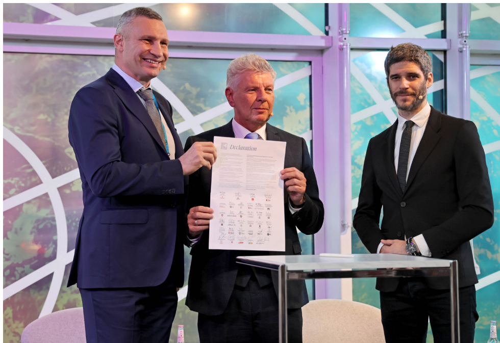
OB Dieter Reiter präsentiert zusammen mit Kyivs Bürgermeister Vitali Klitschko die Erklärung des Pakts der Freien Städte.

Die Stadtpolitik wiederum ist gefordert, Anreize zu schaffen für eine möglichst große Beteiligung der Bevölkerung. Außerdem muss sie den demokratischen Zusammenhalt der Stadtgesellschaft sichern und allen Bürgerinnen und Bürgern die Teilhabe am Gemeinwesen gleichermaßen ermöglichen. ... Letztendlich geht es darum, den Menschen da, wo sie leben, ein freies und selbstbestimmtes Dasein zu ermöglichen. ... Nur so werden wir unsere Demokratie auf Dauer erhalten, stärken und gegen Anfeindungen von innen und außen erfolgreich verteidigen. ... Als Kraftzentren des ganzen Landes sind wir Städte Fundament und Vorbild für das gesamte demokratische Staatswesen. Unser Pragmatismus, unsere Kreativität und Vielfalt prägen aber längst nicht mehr nur das eigene Land. Wir Städte sind vielmehr immer stärker auch in die Netze der Kultur, des Handels und der Kommunikation weltweit eingebunden. Hier entstehen globale Netzwerke, die auf Kooperation fußen, in denen man Probleme an der Wurzel anpackt, auf Pragmatismus statt Ideologie setzt und sich nicht zuletzt als enge Wertegemeinschaft versteht.“