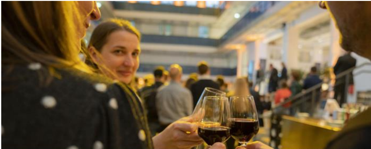
Zum ersten Mal: Tischgespräche in der Halle E