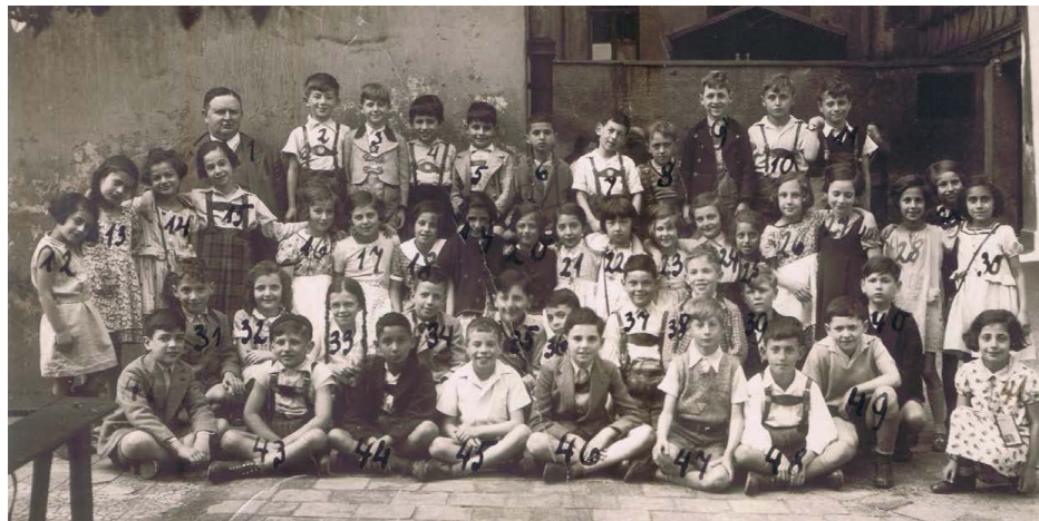
Jüdische Volksschule München, 3. Klasse von 1937/38

Die Veranstaltung ist kostenlos und barrierefrei zugänglich. Anmeldung unter https://eveeno.com/634876903 .