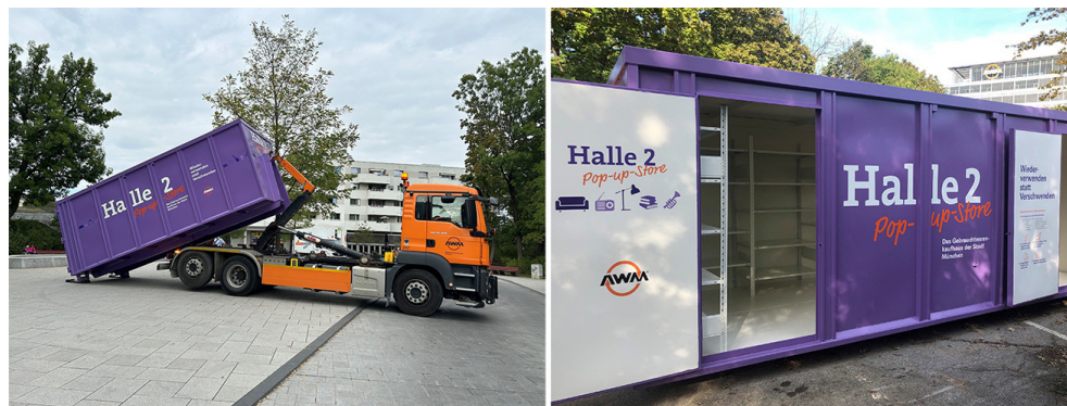
Der Halle 2 Pop-Up-Container

Der AWM ist mit seinem mobilen Halle 2 Container vor Ort, an dem ein Sortiment aus der Halle 2, dem Gebrauchtwarenkaufhaus der Stadt München, zum Verkauf angeboten wird. Die Halle 2, mit Standorten in Pasing und einem Pop-Up-Store in Schwabing, bietet gut erhaltene Secondhandwaren und exklusive Einzelstücke an, die von Münchner*innen gespendet wurden oder anderweitig vor der Entsorgung bewahrt wurden. Der AWM setzt sich aktiv für die Wiederverwendung von Gegenständen ein, um Müllvermeidung zu fördern.