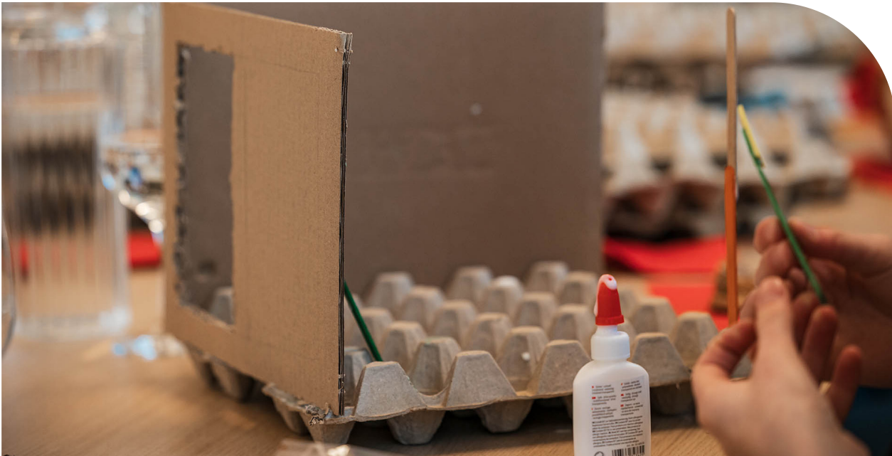
Bild: Gemeinsam haben die Mädchen aus Recycling-Materialien ein Hochhaus gebaut.

Einen Nachmittag lang stellten Kolleg*innen aus Architektur, Planung und IT der Münchner Wohnungsbaugesellschaft fünfzehn interessierten Mädchen* ihren Lebensweg und ihren Arbeitsalltag vor.