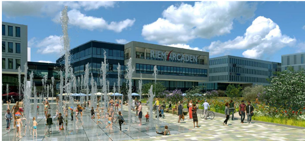
Visualisierung des neugestalteten Willy-Brandt-Platzes

(12.1.2026) Das Baureferat beginnt mit der umfassenden Neugestaltung des Willy-Brandt-Platzes. Der zentrale Platz der Messestadt Riem ist bislang vollständig versiegelt und wird zu einem klimaangepassten, barrierefreien und attraktiven Aufenthaltsort mit vielfältiger Grünausstattung umgebaut. Grundlage der Planung sind Anregungen und Ideen aus der Bürgerschaft vor Ort.