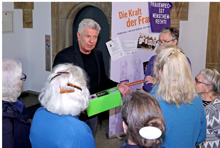
Oberbürgermeister Dieter Reiter bei der Eröffnung der Ausstellung „Die Kraft der Frauen“ im Rathaus

Die Ausstellung nimmt unter anderem die Rolle der Frauen in der politischen Geschichte der „Stunde Null“ in den Blick – vom Kriegsende bis zu den Anfängen des modernen Münchens. Ein weiteres Plakat befasst sich mit dem langen Weg der Umsetzung des Grundrechts auf Gleichberechtigung von Mann und Frau. Darüber hinaus werden auch die Lebensläufe von Münchnerinnen in der Politik und von Frauen in München nach 1945 betrachtet.