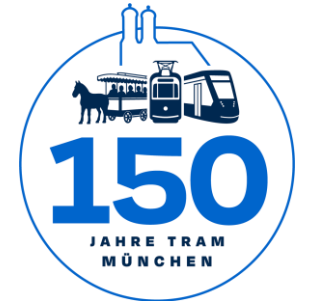
Geburtsgruß aus dem Jahr 1876, in dem die erste Tram durch München fuhr.

Außerdem wird in den nächsten Wochen eine Jubiläumsbroschüre veröffentlicht, die die Geschichte der Tram und den Menschen hinter dieser Geschichte würdigt.