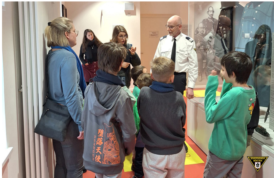
Die Feuerwehrausstellung am Unteren Anger bietet jetzt auch Führungen in Gebärdensprache an.

Die Münchner Feuerwehrausstellung wurde 1979 eröffnet und ist seitdem eine zentrale Anlaufstelle für Feuerwehrinteressierte. Der Bau wurde maßgeblich von Feuerwehrleuten selbst durchgeführt. 1984 wurde das Museum um eine besonders eindrucksvolle Attraktion erweitert: eine ausgebrannte U-Bahn, die an den verheerenden Brand von 1983 erinnert. Nach fünfjähriger Umzugspause eröffnete die Feuerwehrausstellung im Oktober 2024 in neuen Räumlichkeiten und erfreut sich seither großer Beliebtheit. Die Ausstellung ist samstags 10 bis 17 Uhr geöffnet und der Eintritt ist kostenlos. Führungen sind ab einer Gruppe von 15 Personen möglich. Mehr Infos unter stadt.muenchen.de/infos/feuerwehrausstellung-muenchen .