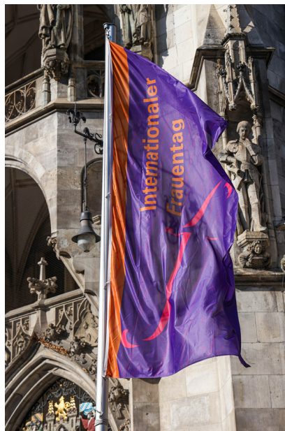
Beflaggung zum Internationalen Frauentag

Auch in diesem Jahr setzen wir am Marienplatz mit den lila und orangenen Flaggen der Gleichstellungsstelle für Frauen ein sichtbares Zeichen für Gleichberechtigung, Respekt und Solidarität.“