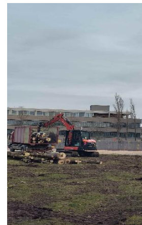
Fotos: hinter und neben VKB Gebäude Deisenhofener Str. 75 am 2026-02-22, Baumabtransport am 2026-02-23