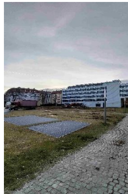
Foto links: einen Tag vor den Fällungen Standpunkt ca. Höhe Warrgauer Str. 30 Blickrichtung Deisenhofener-/Untersbergstraße am 2026-02-22