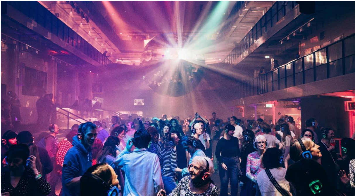
Silent Disco in der Halle E